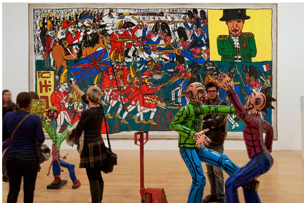
Vue de l'exposition « Robert Combas, Greatest Hits », au musée d'art contemporain de Lyon, 2012. © Blaise Adilon. © Adagp, Paris, 2012.

Le premier, classique, débute par un accrochage chronologique, le temps de donner aux visiteurs les clés de ses jeunes années (la bande dessinée, les enseignes de Barbès). Les salles suivantes voient les toiles réparties par thèmes, sans soucis